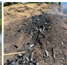
Ramassage du charbon