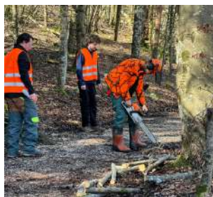
Coupe du bois en mars par les élèves de l'Iseta à Poisy