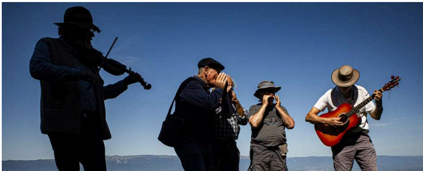
Groupe de musique Harmonica en Bornes

La Fête du Salève s'est tenue cette année le 7 septembre à l'alpage de la Thuile sur la commune de Beaumont, rassemblant un large public venu profiter d'une magnifique journée au cœur du massif, en somme : une belle réussite.