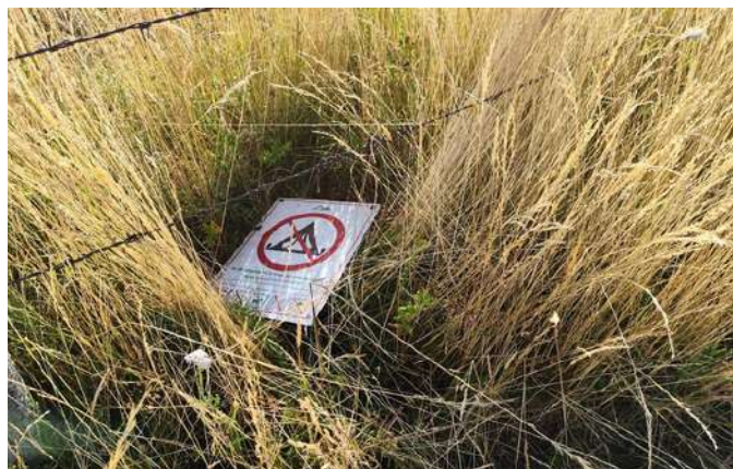
Panneau d'interdiction arraché et jeté au sol par des publics récalcitrants...