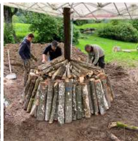
Montage de la charbonnière